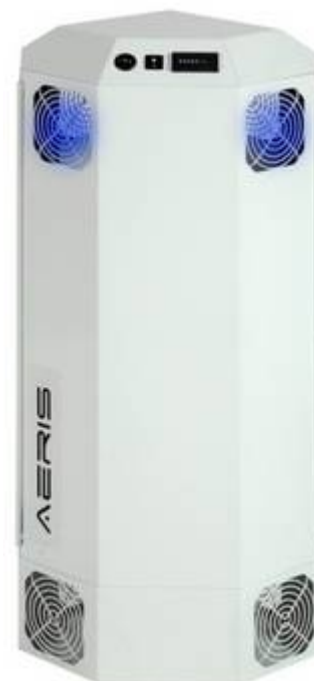
Modelo AERIS (Portátil negro y blanco)