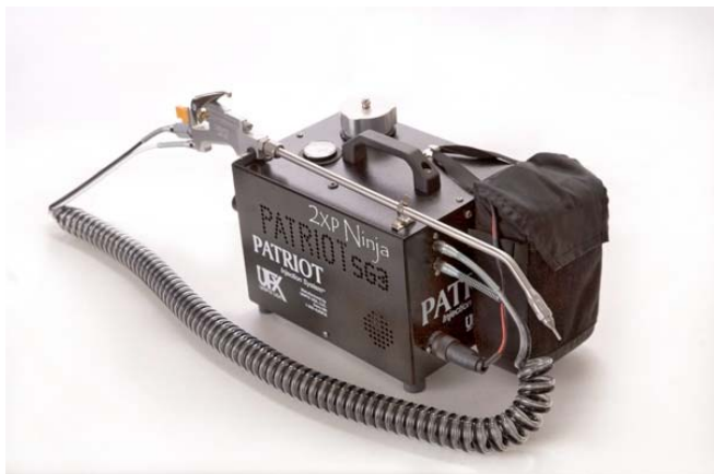
Patriot 2XP Ninja con la batería conectada

El PATRIOT está fabricado con los mayores estándares de calidad. Su tanque está fabricado en acero inoxidable de 70.72 onzas, cuando en el resto de la industria, lo normal es fabricar con 28 onzas.