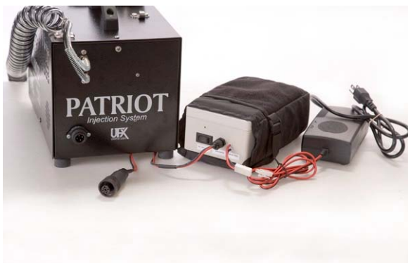
Patriot 2XP Ninja con los conectores de la batería y cargador de 3 A. La batería está fabricada en una caja de seguridad a prueba de fuego

El PATRIOT está fabricado con los mayores estándares de calidad. Su tanque está fabricado en acero inoxidable de 70.72 onzas, cuando en el resto de la industria, lo normal es fabricar con 28 onzas.